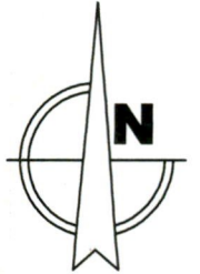
UTR nr. 5